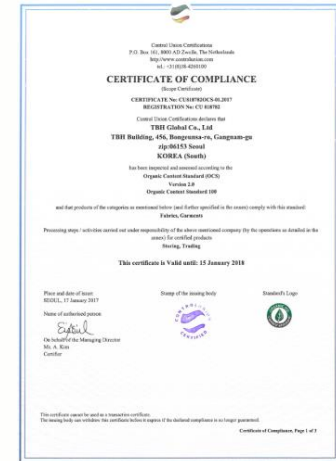
2017년도 OCS 인증서 ▶

(주)티비에이치글로벌의 베이직하우스에서 생산하는 유기농 제품을 위한 유기농 인증 절차가 올해에도 진행되어 인증을 획득할 예정입니다. 2007년도부터 지속적으로 출시된 베이직하우스의 유기농 제품은 국제인증 OCS의 엄격한 인증을 거쳐 100% 유기농 원사를 소재로 사용한 친환경 제품만 생산합니다. 이는 보다 친환경적이고 사람의 몸에 이로운 제품을 생산하고자 하는 회사의 지속적인 노력의 일환으로 앞으로도 계속되어질 예정입니다.